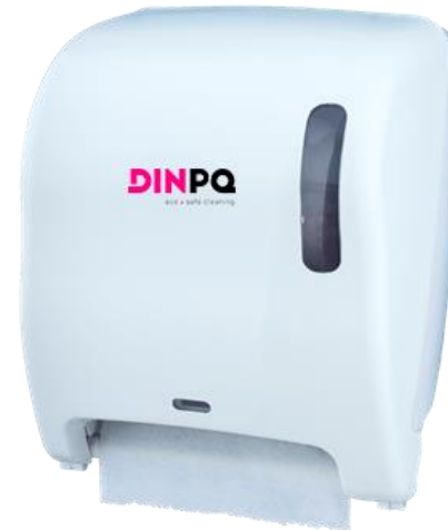
TOALLA AUTO Bobina secamanos Secado x arrastre Dispensación automática