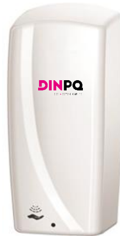
DERMIGEL Jabón Dermoprotector Dispensación automática