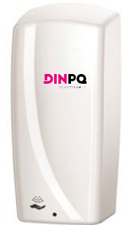
OCEANO Desinfectante Hidroalcohólico Dispensación automática